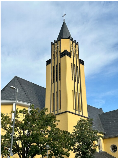
Der Turm der Kirche St. Josef in Köln-Porz von der Hauptstraße aus (2023).