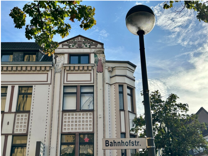
Das Haus Bahnhofstraße Nr. 6a in Porz-Mitte stammt aus dem Jahr 1907. Einst wurde es von der Hauptstraße aus als Nr. 88 gezählt (2023).