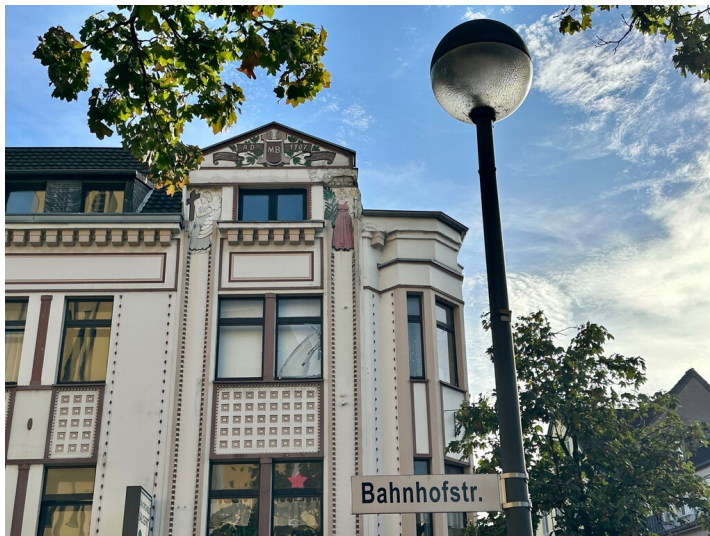
Das Haus Bahnhofstraße Nr. 6a in Porz-Mitte stammt aus dem Jahr 1907. Einst wurde es von der Hauptstraße aus als Nr. 88 gezählt (2023).