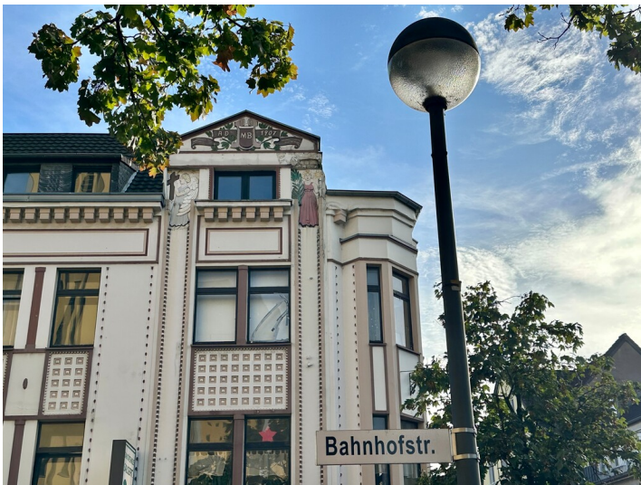
Das Haus Bahnhofstraße Nr. 6a in Porz-Mitte stammt aus dem Jahr 1907. Einst wurde es von der Hauptstraße aus als Nr. 88 gezählt (2023).