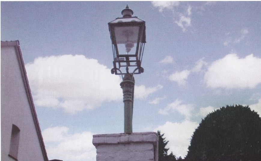
Die Puricelli-Gaslaterne, errichtet um 1895.