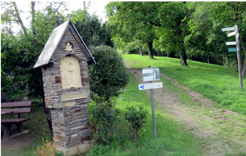
Kreuzwegstation Jesus begegnet seiner Mutter (2023)