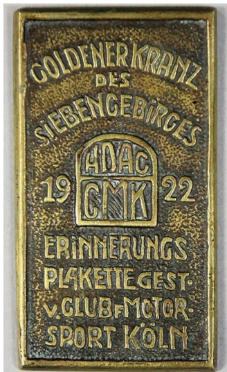
Erinnerungsplakette zum Motorradrennen "Goldener Kranz des Siebengebirges" am 1. Oktober 1922.