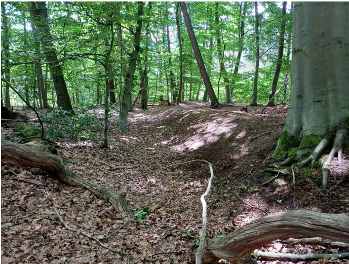
Die Schießanlage belgischer Besatzungstruppen im Baerler Busch ist heute stark bewachsen, die Struktur im Gelände aber dennoch erkennbar (2023).