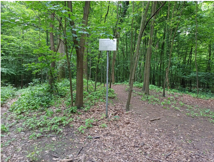
Links des Weges wird ein Grabhügel des Wedauer Hügelgräberfeldes als leichte Erhebungen im Gelände sichtbar (2023).