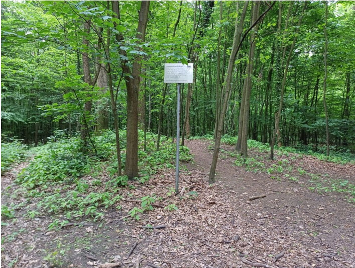
Links des Weges wird ein Grabhügel des Wedauer Hügelgräberfeldes als leichte Erhebungen im Gelände sichtbar (2023).