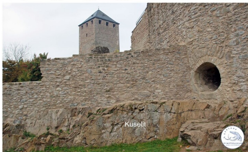
Grafik zum Profil des Felssporns Lichtenberg und des Gesteins Kuselit (2023)