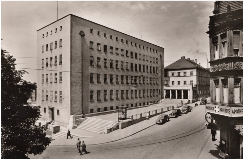
Die ehemalige Hauptpost, Ecke Bahnhofstraße-Schützenstraße (1950er Jahre)