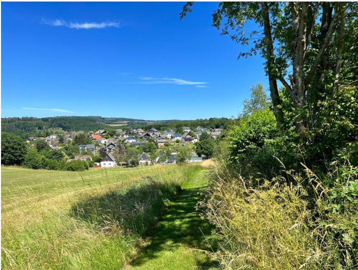
Ausblick auf Streithausen und Zuweg zum Rundgang am Baum-des-Jahres-Park in Streithausen (2022)