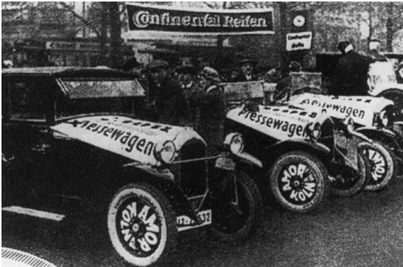
Als Werbung bei Zuverlässigkeitsfahrten und Autorennen gestaltete "Amorwagen" der Kölner Amor-Automobilbau GmbH bzw. Lefrère Motorfahrzeuge AG (1925).