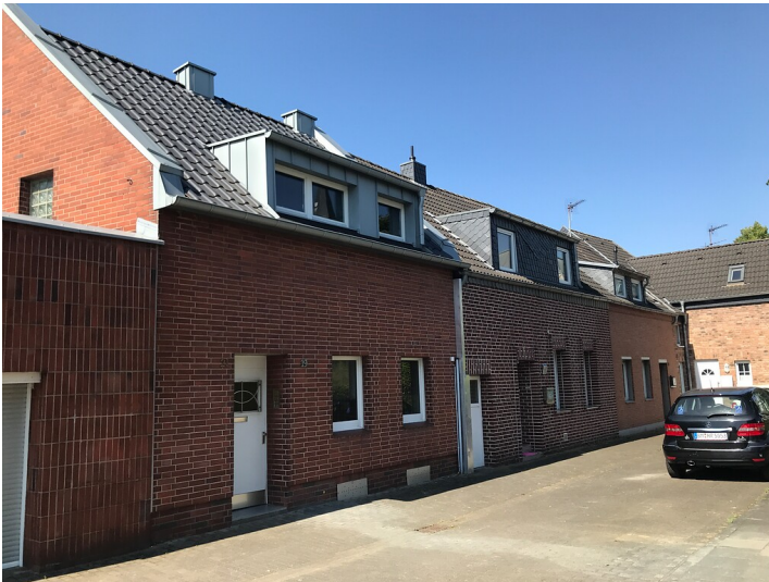
Arbeiterwohnhausreihe in der Hochstedenstraße (2022)