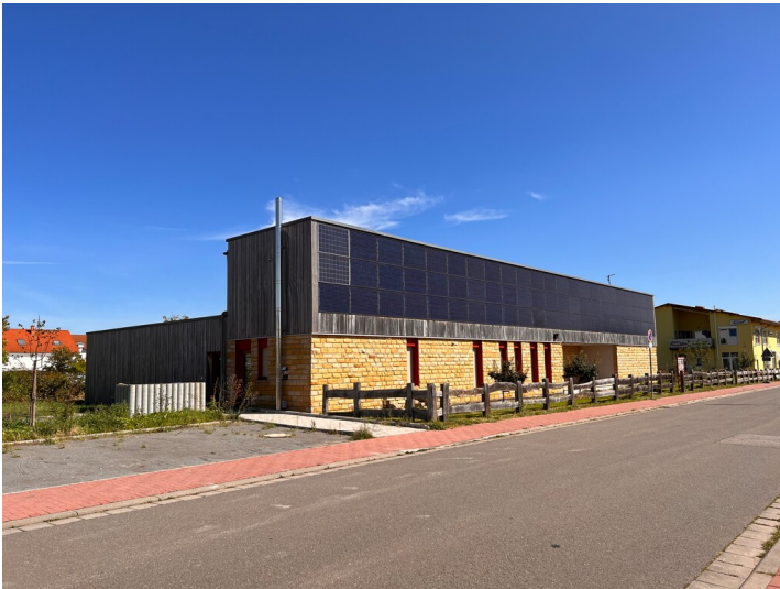
Haus der Artenvielfalt in Neustadt