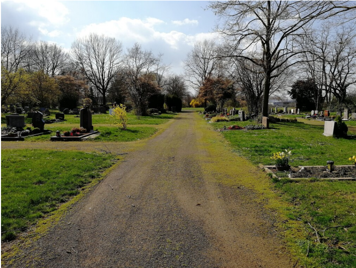
Zentraler Weg auf dem Nordfriedhof