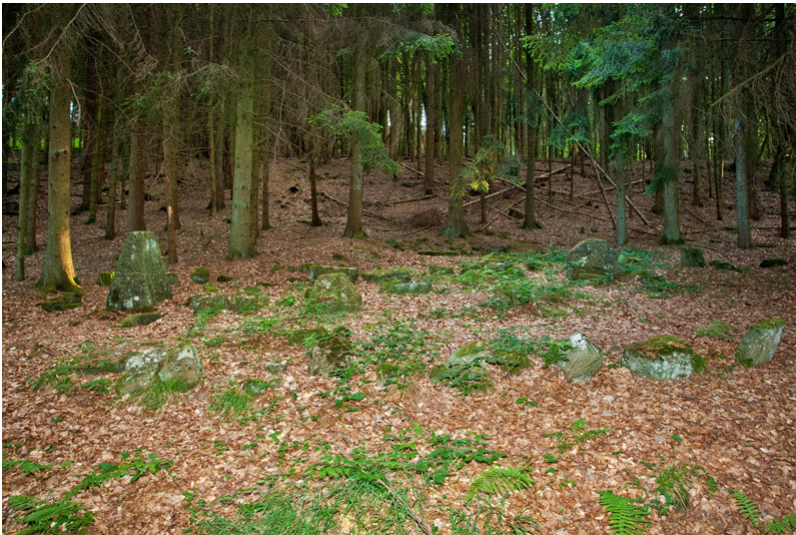
Gallorömisches Gräberfeld bei Holsthum