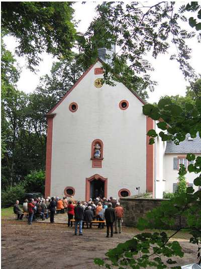
Schankweiler Klause