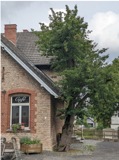
Alter Birnbaum in Nettersheim-Frohngau (2023)