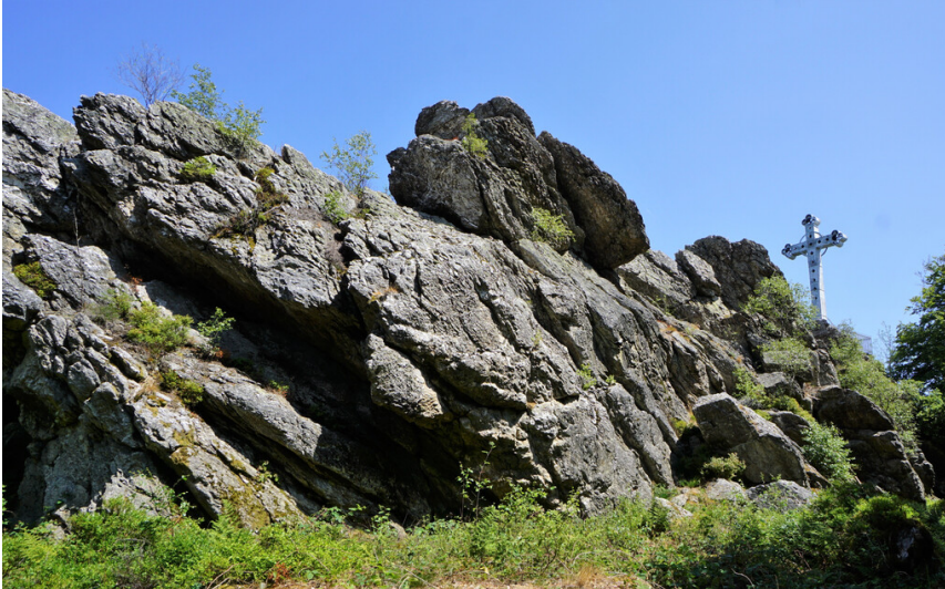
Das 6 Meter hohe "Kreuz im Venn" steht auf einem Konglomeratfelsen (2023).