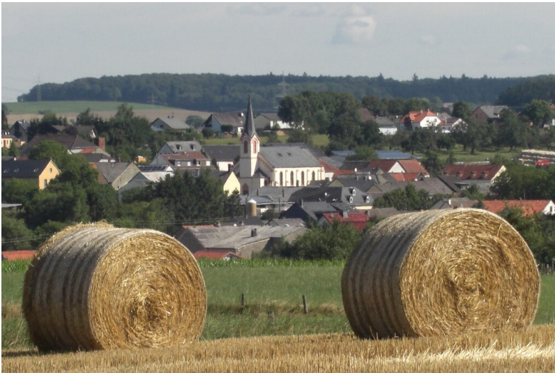
Katholische Pfarrkirche St. Martin in Eisenach