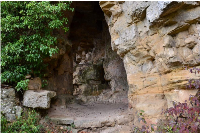
Einsiedelei auf dem Ernzerberg bei Echternacherbrück