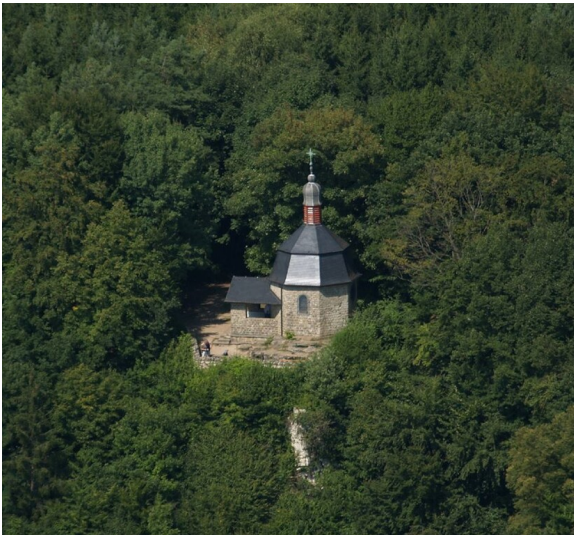
Liboriuskapelle bei Echternacherbrück