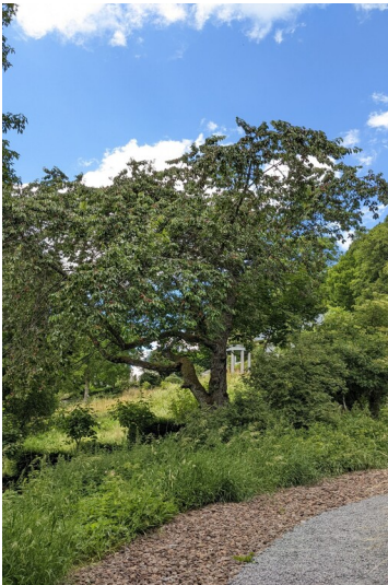
Alter Kirschbaum in Kronenburg (2022)