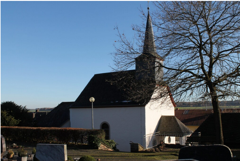
Filialkirche St. Katharina in Trimport