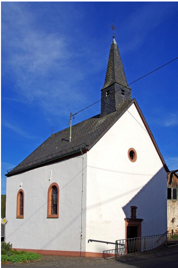
Filialkirche St. Walburga in Usch