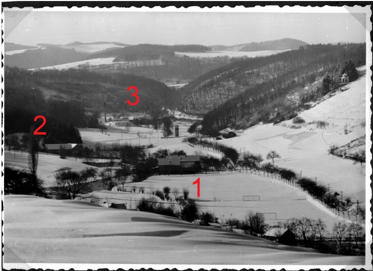
Blick ins Gleeser Bachtal