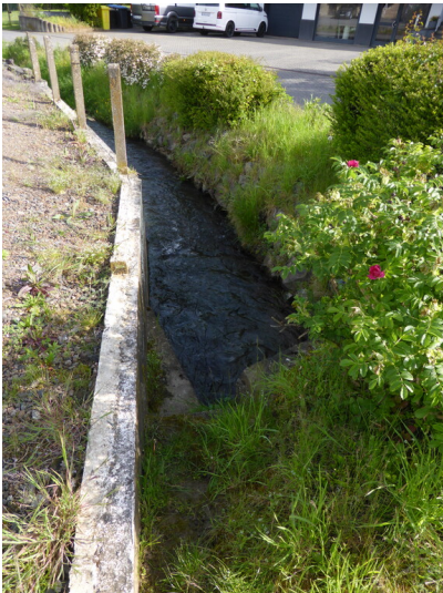
Wirrbach nördlich der Loths-Mühle in Niederzissen (2024)