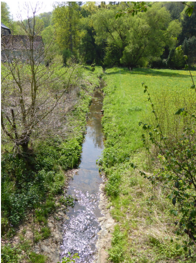
Pönterbach an der Krayermühle in Kell (2019)