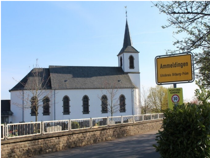
Pfarrkirche St. Isidor in Ammeldingen bei Neuerburg