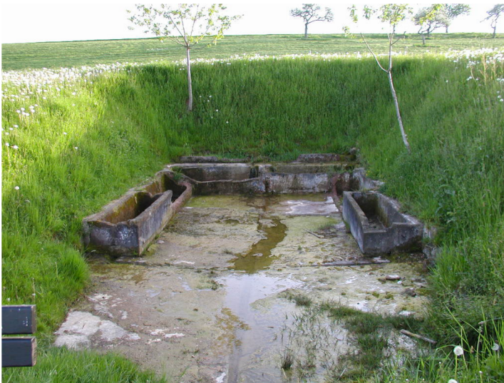
Waschhaus am Weilbachtal