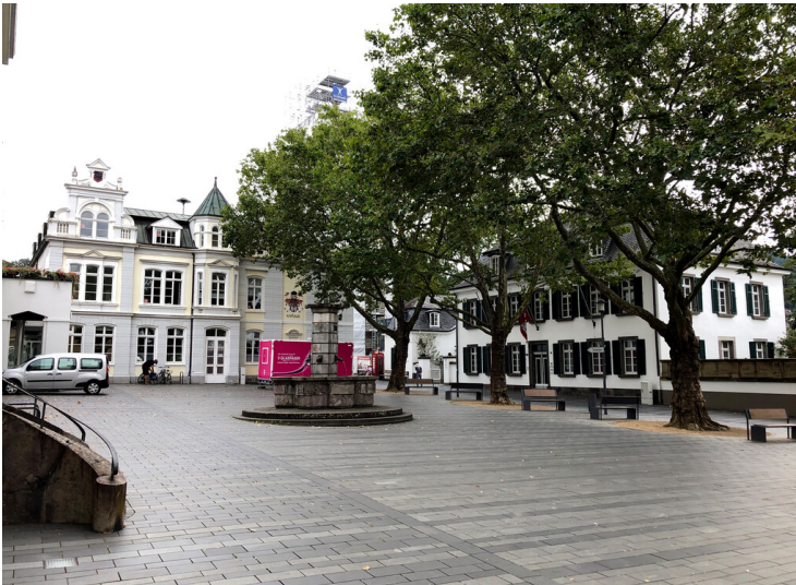
Marktplatz und Rathaus Königswinter (2023)