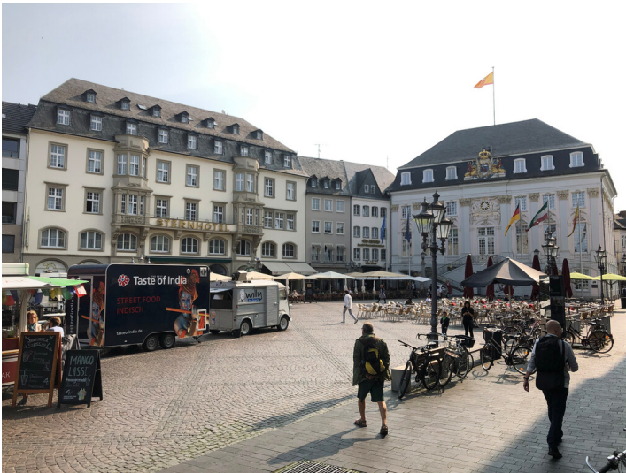
Marktplatz und Rathaus Bonn (2023)