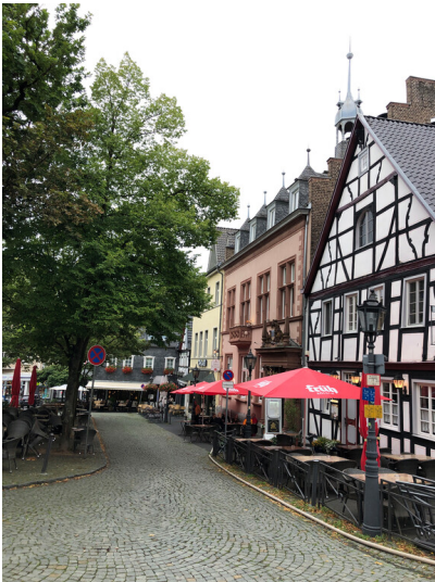
Marktplatz und altes Rathaus in Bad Honnef (2023)