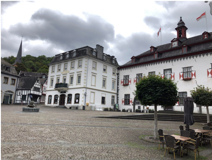
Marktplatz und Rathaus in Linz am Rhein (2023)