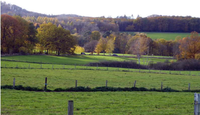
Gelände westlich von Himberg, Nähe Servatiuskapelle, Schauplatz der direkten Konfrontation zwischen der Separatisten und der Bürgerwehr am 16. November 1923 (2023)