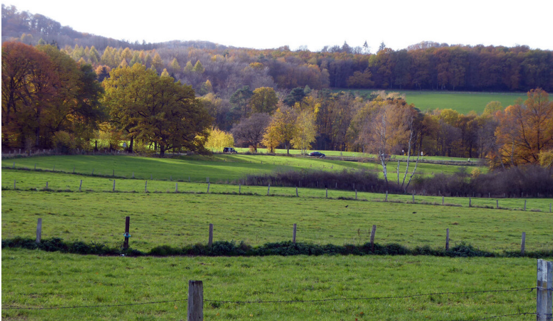
Gelände westlich von Himberg, Nähe Servatiuskapelle, Schauplatz der direkten Konfrontation zwischen der Separatisten und der Bürgerwehr am 16. November 1923 (2023)