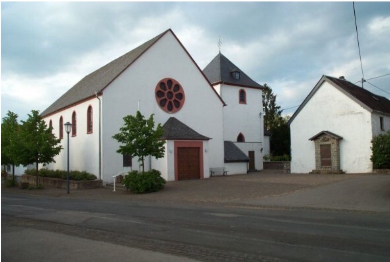
Katholische Pfarrkirche St. Servatius und St. Matthias in Dahlen