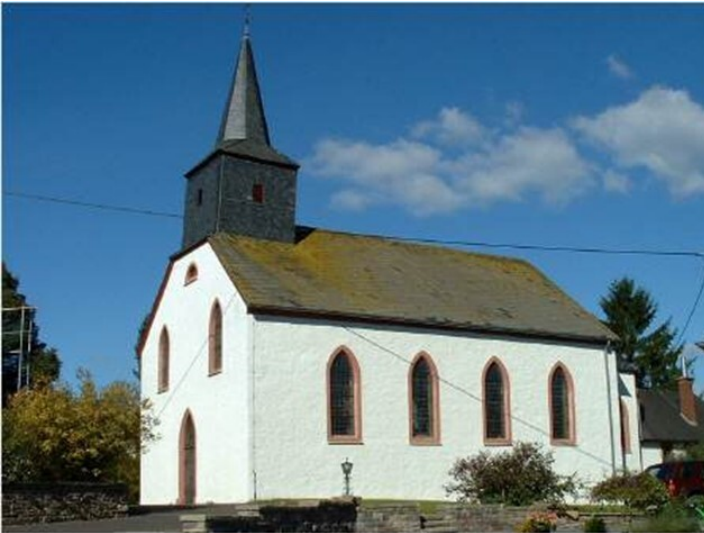
Katholische Pfarrkirche St. Nikolaus in Üttfeld-Binscheid