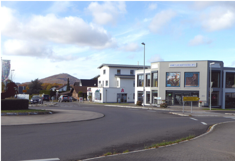
Kreuzung Himberg in Bad Honnef (2022)