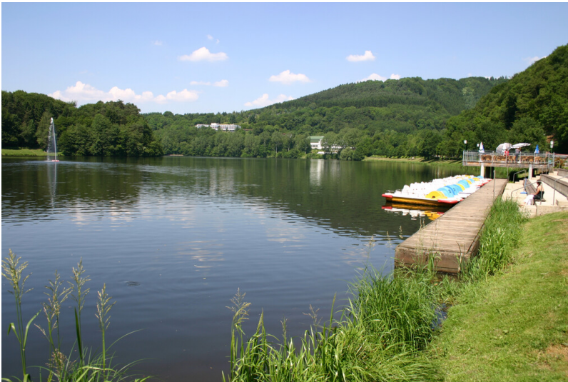
Stausee Bitburg