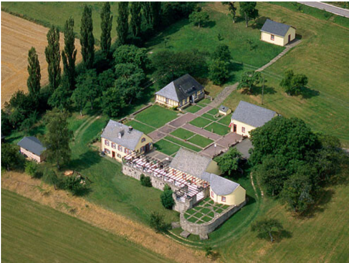
Römische Villa Otrang bei Fließem