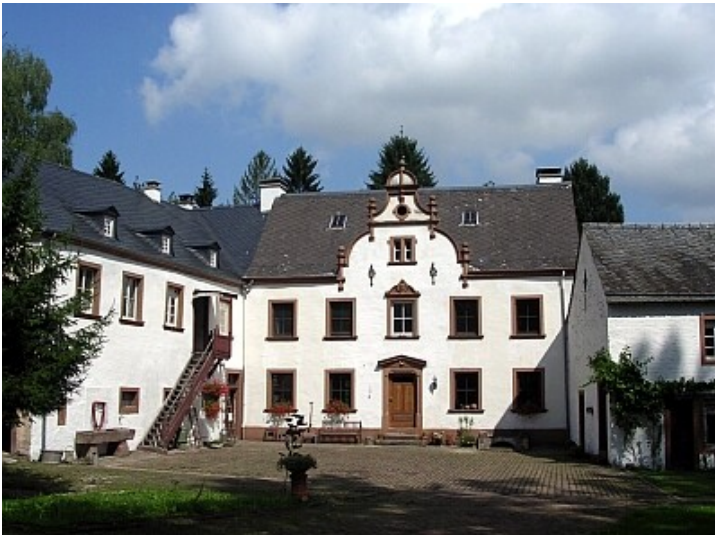
Gut Pfalzkyll bei Röhl