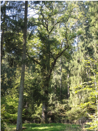
Napoleonseiche im Roßbachwald bei Mael