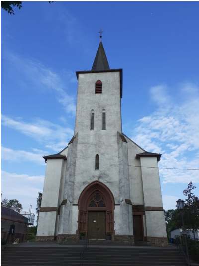
Pfarrkirche St. Hubertus in Großkampenberg