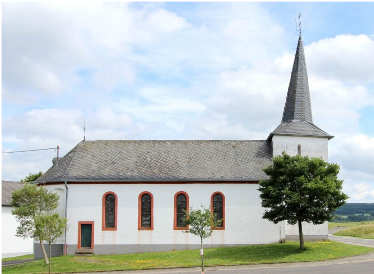
Außenansicht der Kapelle Heiliger Stephanus in Oberlascheid