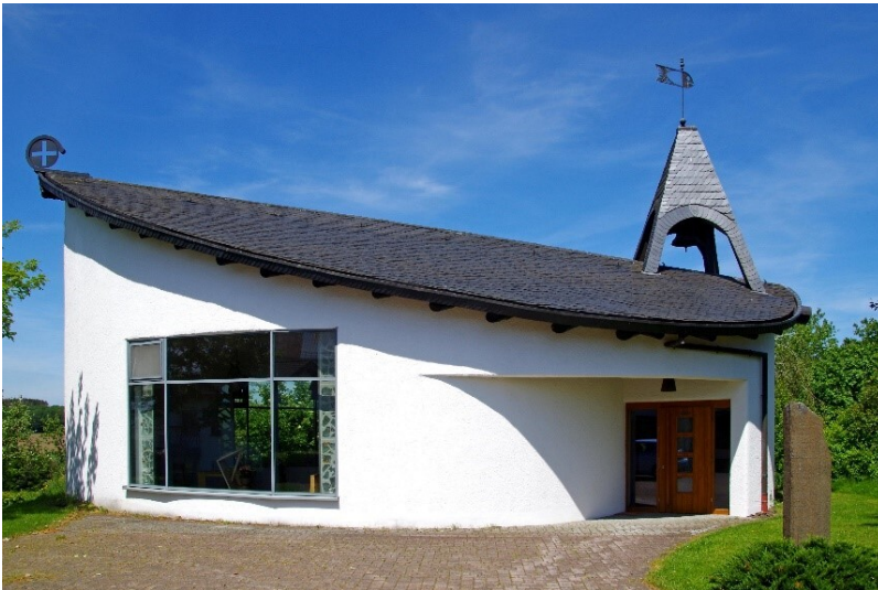
Sankt-Barbara-Kapelle in Buchet