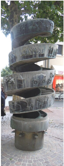
Historienbrunnen an der Georgskapelle in Bergheim (2012)