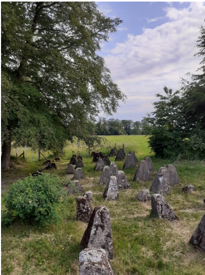
Gedenkstätte Höckerlinie des Westwalls bei Großkampenberg