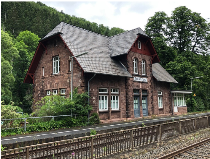
Bahnhof in Auw an der Kyll