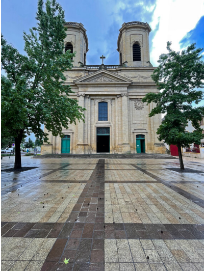
Kirche Sankt Maximin in Thionville (2023)